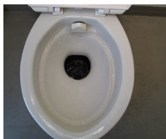
8月5日 3,108人利用後状態