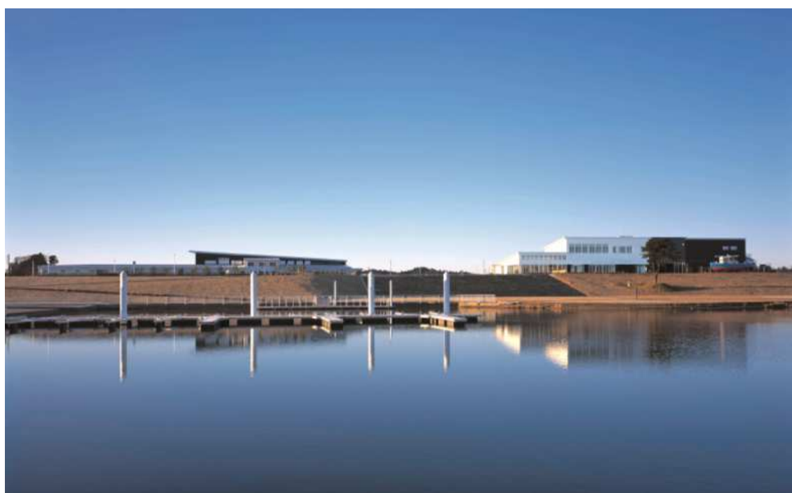
「道の駅 水の郷佐原」の全景写真（利根川より）