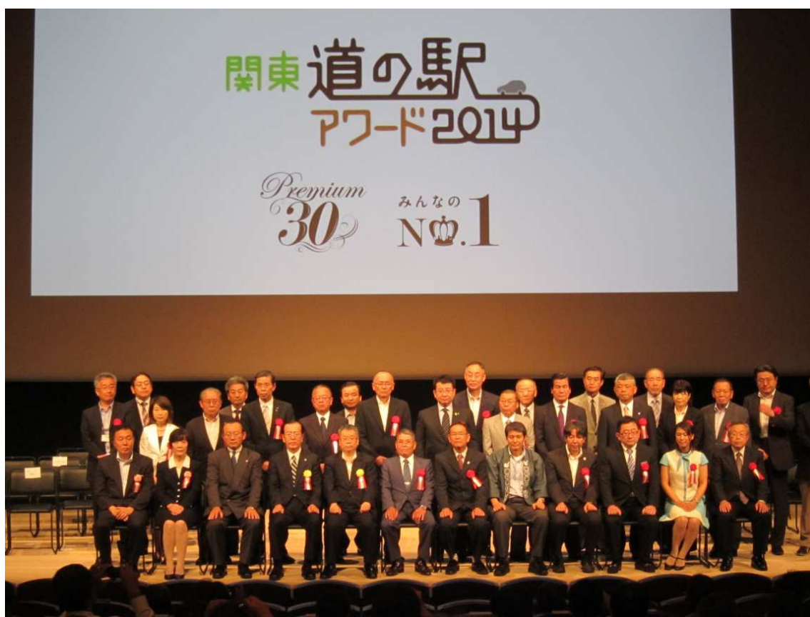
「プレミアム 30」に選ばれた道の駅関係者の記念写真（最後列左から3人目が代表登壇者の香取市）