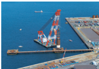
南本牧地区に建設中の臨港道路橋脚

世界的にコンテナ船の大型化が進んでいることへの対応として、京浜港と阪神港が「国際コンテナ戦略港湾」に選定され、航路の増深や岸壁・アクセス道路などの整備が行われています。当社は現在、南本牧地区（横浜市）で臨港道路橋梁下部工事を、ポートアイランド地区（神戸市）で航路等の浚渫工事を施工しており、これからも「海洋国家日本」の復権に向けた関連事業に積極的に取り組んでまいります。