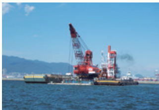
ポートアイランド沖の航路を浚渫する讃岐号