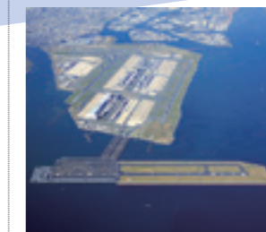
東京国際空港D滑走路建設外工事(東京都)

21世紀に入り、国民の安全・安心の確保や国際競争力の強化、途上国のインフラ整備等の重要性が高まっています。特に近年は自然災害が多発しており、減災・防災への取り組みが大きなテーマとなっています。当社は、これからも高い技術力を発揮し、国内外で多様化する社会基盤整備に貢献し続け、皆様の期待に応えることのできる会社として100周年を迎えるよう努力してまいります。