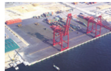
六甲アイランド緊急岸壁復旧工事(兵庫県)