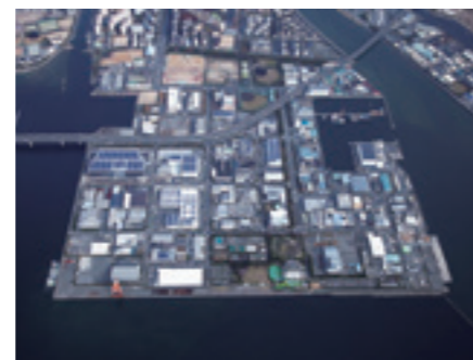
現在の鳴尾浜(兵庫県)