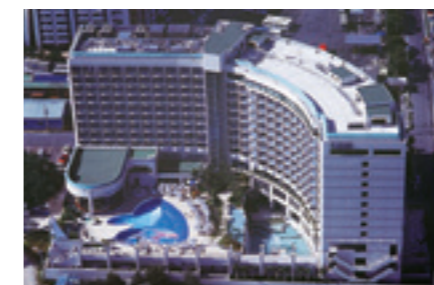
ロワジュールホテル那覇(沖縄県)