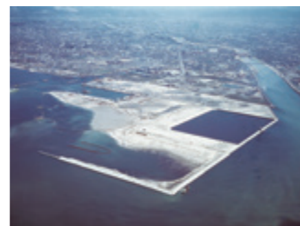
鳴尾埋立事業の状況(1973年4月)