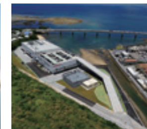
株式会社武蔵野沖繩 沖繩工場(沖縄県)