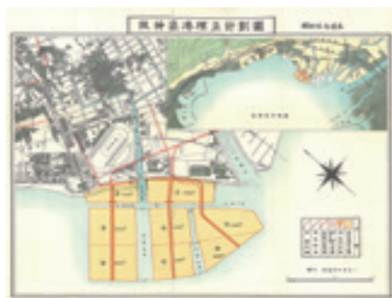
当時の埋立計画図