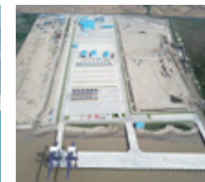
ティラワ港コンテナターミナル建設工事(ミャンマー)