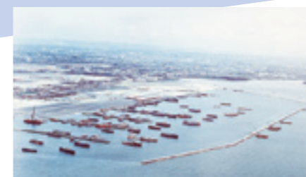
ナボタス漁港建設工事(フィリピン)

●建築部・建築営業部設置(建築部門進出) ●フィリピンに合併会社CCTを設立 ●東京本部を東京本社に改称