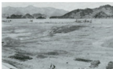
佐伯航空隊敷地埋立工事(大分県)