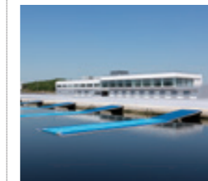
海の森水上競技場(東京都)