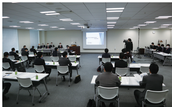
会場とオンラインを併用して開催した決算説明会