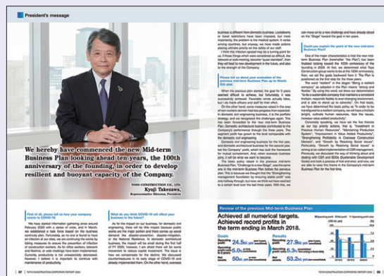
英語版コーポレートレポートのPDFを掲載