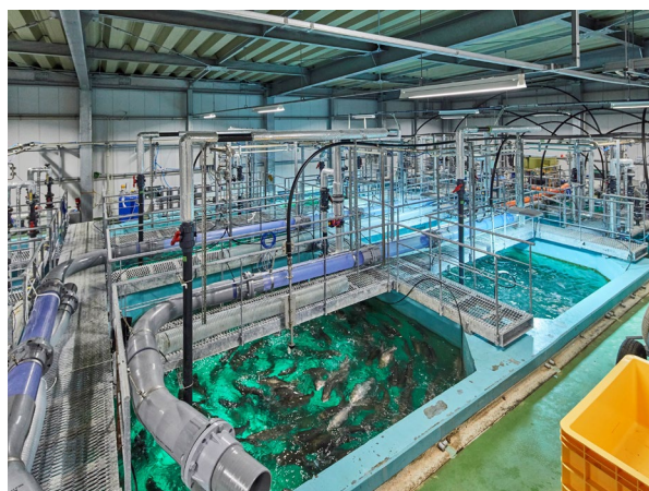
FRD 様の稼働中の養殖水槽