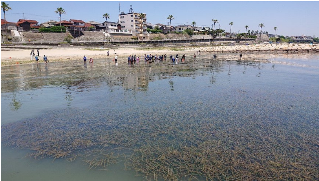
アマモ種子の採取状況